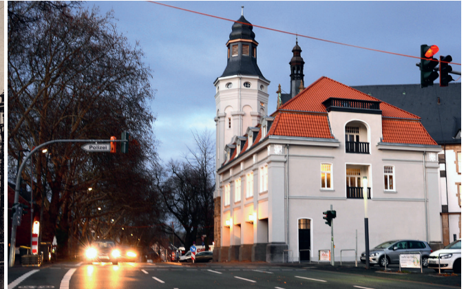
Das Feuerwehrdepot Recklinghausen nach der Sanierung im Jahr 2019