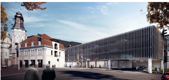
Entwurfsansicht vom Herzogswall