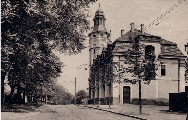
Das Feuerwehrdepot Recklinghausen kurz nach der Einweihung im Jahr 1909